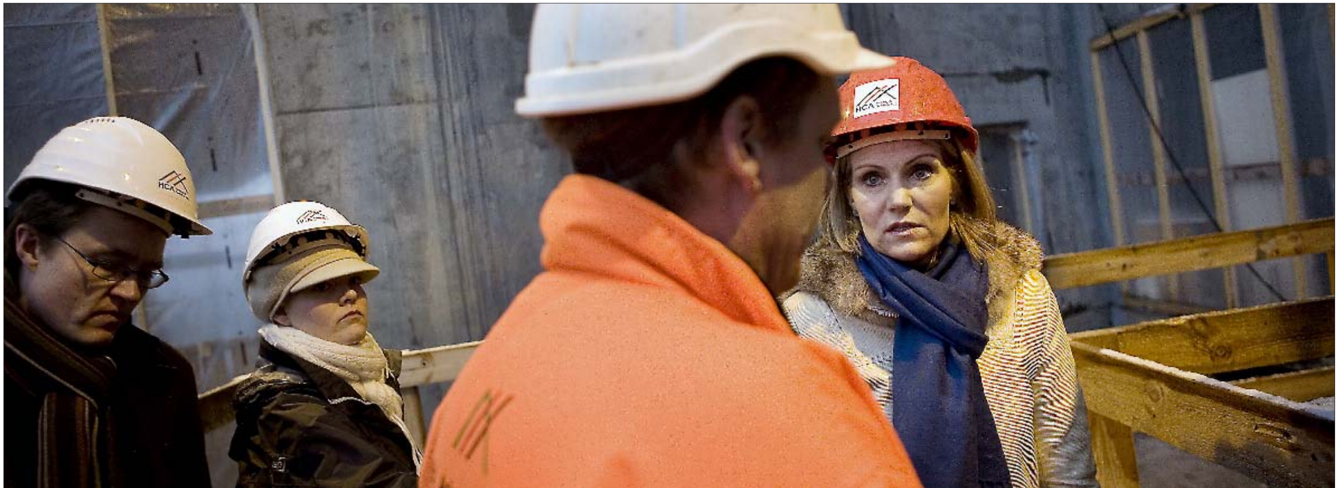
SIKKERHEDSUDSTYR. Lige nu forudser prognoserne, at ledigheden vil stige til over 100.000 inden årets udgang og fortsat vokse i 2010. Dermed skulle banen være kridtet op til socialdemokratisk dominans. Men så let går det nok ikke.